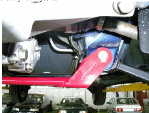
На распорке выбито клеймо AUTOPRODUCT .